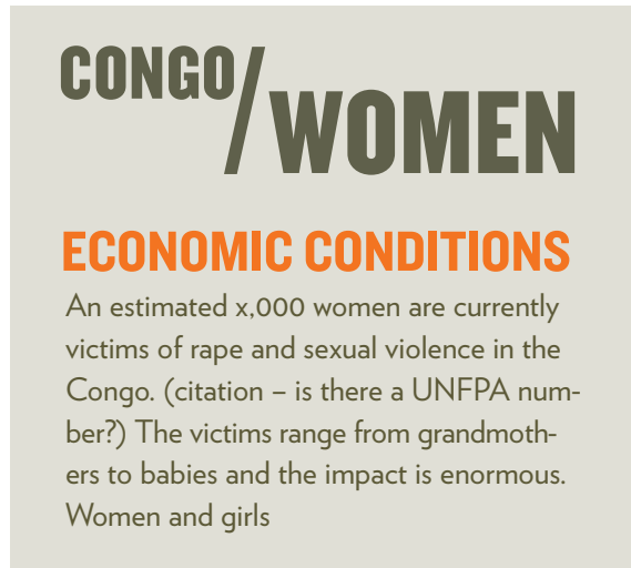
Example 1: on Lt. grey bckgrnd (PMS 413)