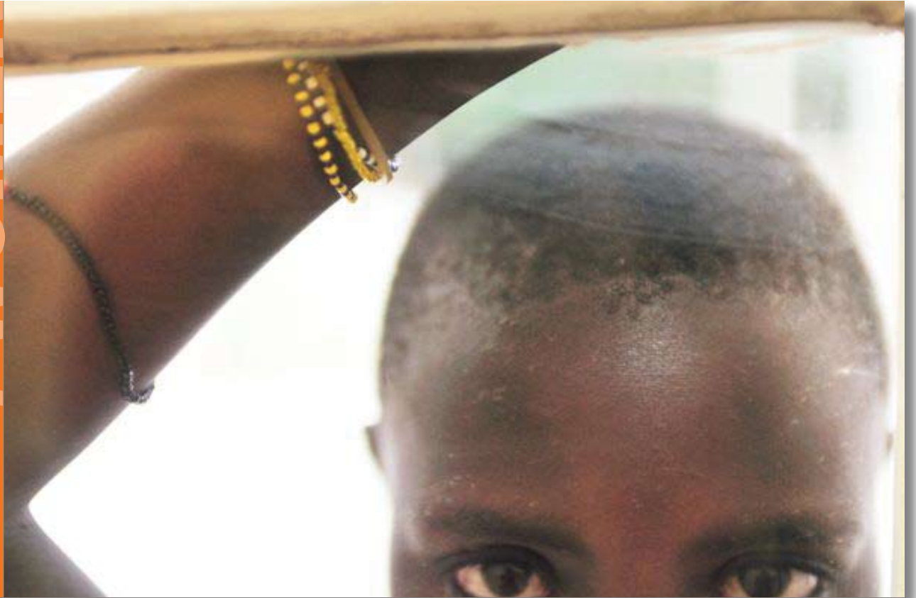
Sample of Invitation design