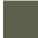
PMS 418 RGB: R= 95 G=96 B=75