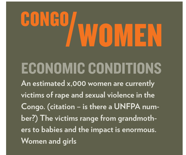
Example 4: on Dk. grey bckgrnd