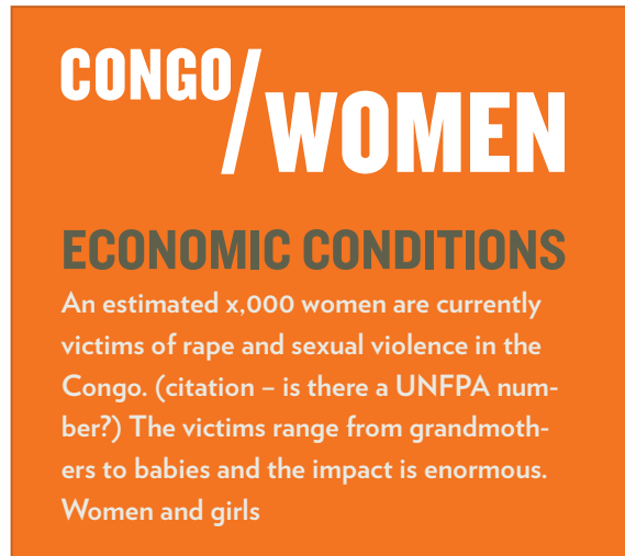
Example 3: on red bckgrnd