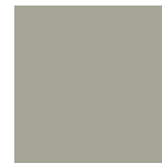
PMS 415 RGB: R= 166 G=166 B=152