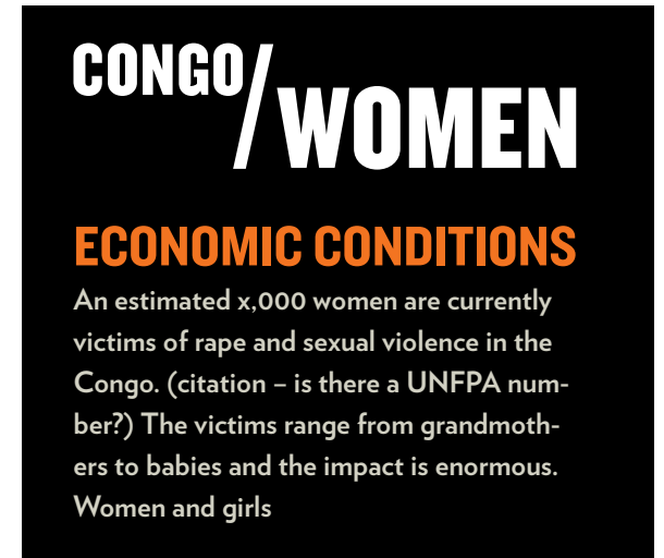
Example 2: on black bckgrnd