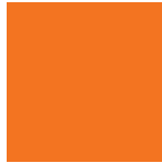
PMS 1655* RGB: R=199 G=95 B=26